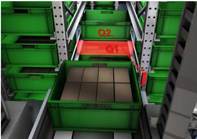
Bild 2. Mit zwei individuell einstellbaren Tastweiten genügt im Behälterlager ein Reflexions-Lichttaster HRTR 46B-TEACH zur Fachbelegtkontrolle. Über die IO-Link-Schnittstelle können sogar beliebige Distanzen im Prozess abgefragt werden.